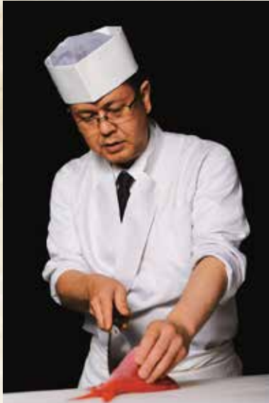
日本料理 あづま AZUMA

お一人様につき 国産牛サーロインステーキ 国産マツタケの土瓶蒸し それぞれプレゼント