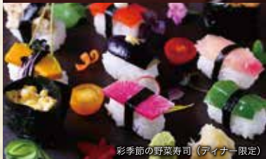
彩季節の野菜寿司 (ディナー限定)