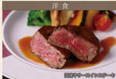
国産牛サーロインステーキ