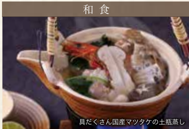
具だくさん国産マツタケの土瓶蒸し