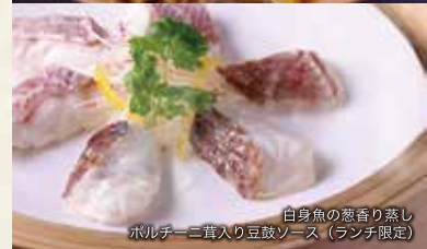
自身魚の葱香り蒸し ポルチーニ茸入り豆鼓ソース (ランチ限定)