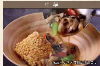
松茸入りキノコ鍋かけおこげ