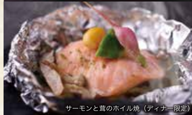
サーモンと茸のホイル焼 (ディナー限定)