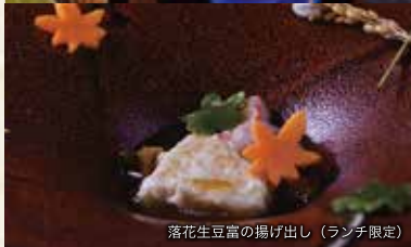
落花生豆腐の揚げ出し (ランチ限定)