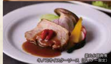
柔らか豚角煮 キノコオイスターソース (ディナー限定)