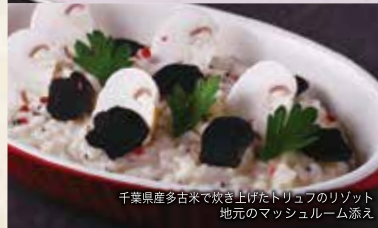
千葉県産多古米で炊き上げたトリュフのリゾット 地元のマッシュルーム添え