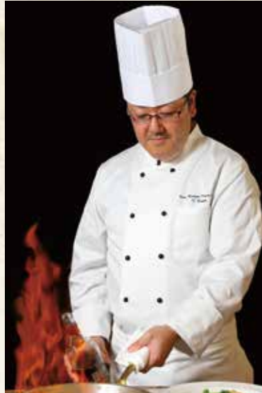
RESTAURANT Gardenia ガーデニア